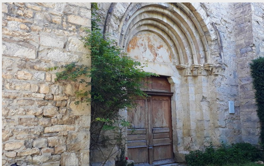
Notre Dame de Calma (CCSB)