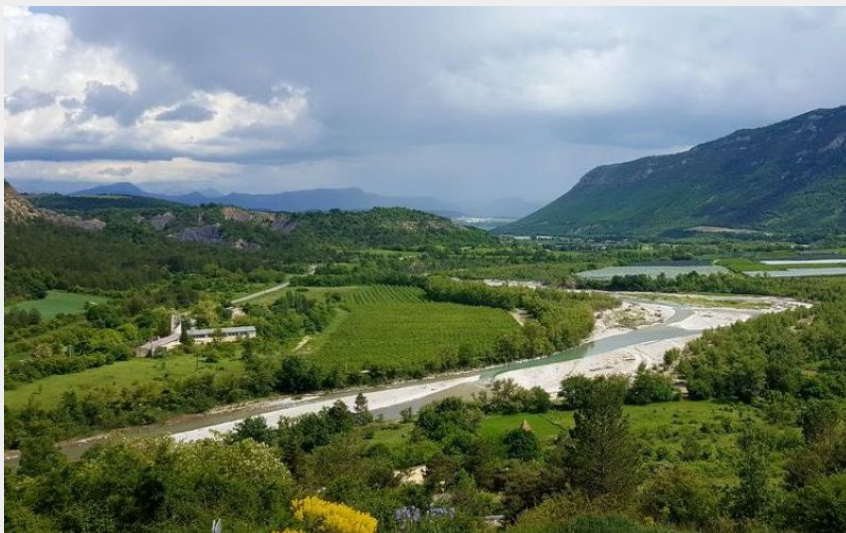
Le Buëch et le plateau de Saléon (Office de tourisme Sisteron Buëch)