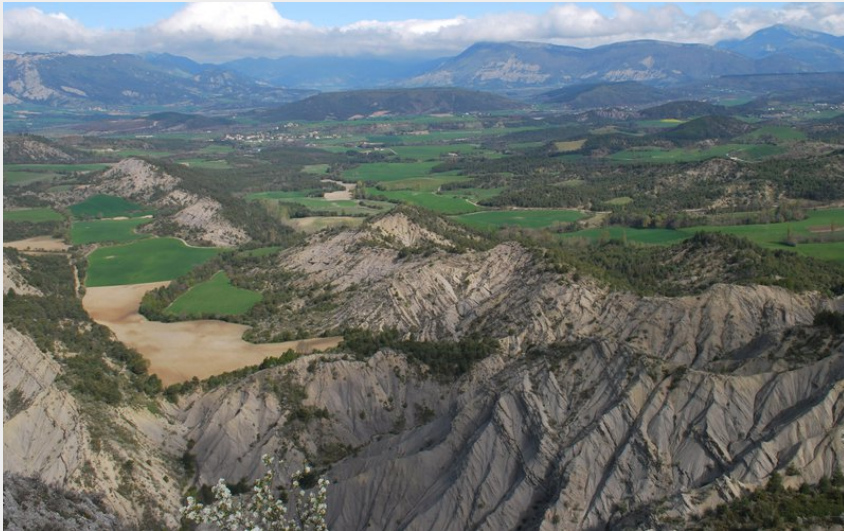
Panorama sur le Serrois (CCSB)