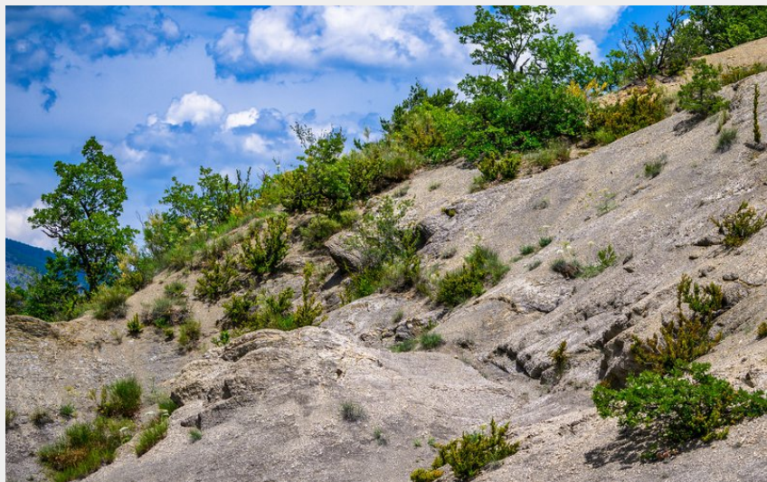
Passage dans les marnes