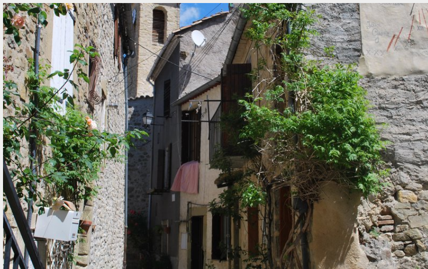
Centre du village de Rosans (CCSB)