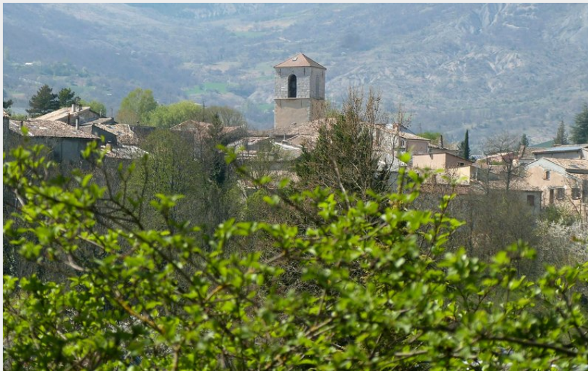
Village de Ribiers (CCSB)