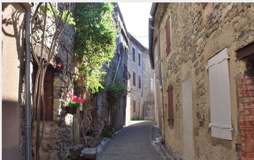
Ruelles de l'Épine (CCSB)