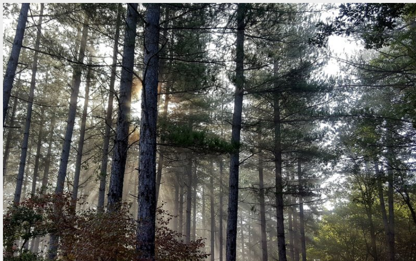
Ambiance mystérieuse dans le Bois de la Garenne