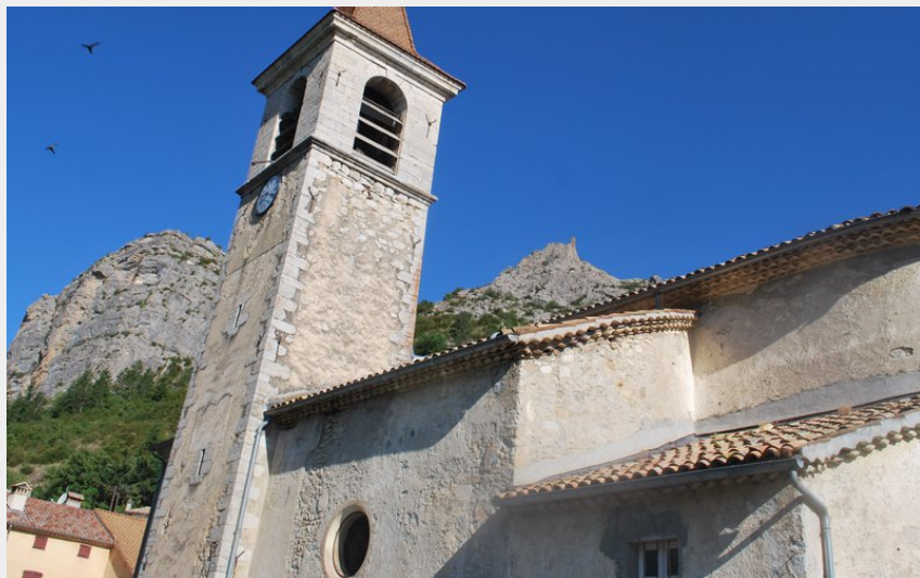
Le village d'Orpierre (CCSB)