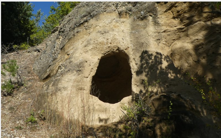
Cabane troglodyte (CCSB)