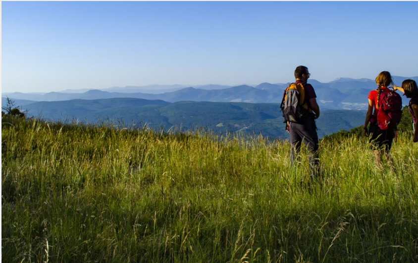
Le Col des Casset (CCSB)