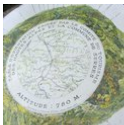
Table d'orientation (A)

Au détour d'un lacet du sentier et juste à côté de la Chapelle Notre-Dame-de-Bon-Secours, profitez d'une superbe vue sur la vallée du Buëch. Un table d'orientation érigée par le Comité du Tourisme des Hautes-Alpes et la Commune de Serres permet de profiter du panorama.