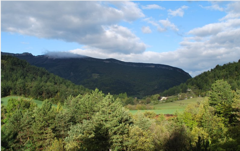
Vue sur le Rocher de Beaumont (CCSB)