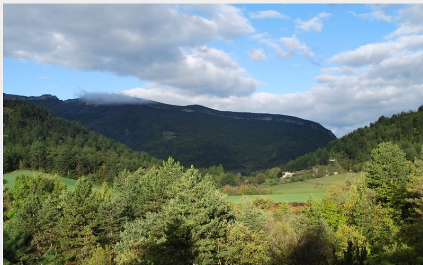
Vue sur le Rocher de Beaumont (CCSB)