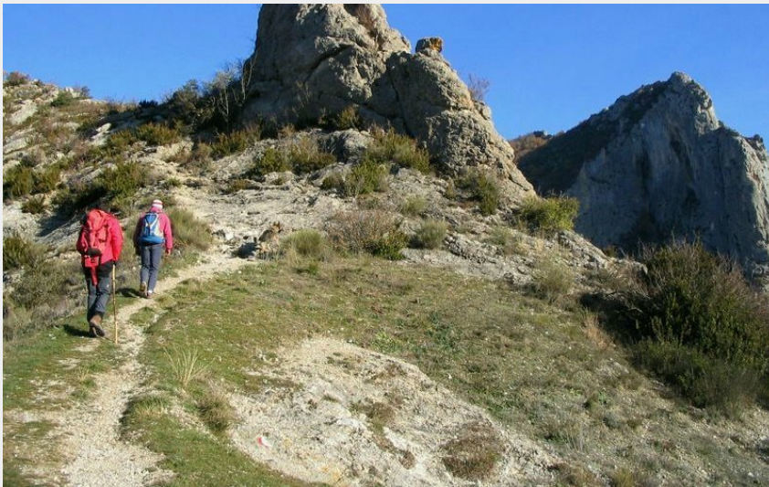
Falaises et vue panoramique (CCSB)