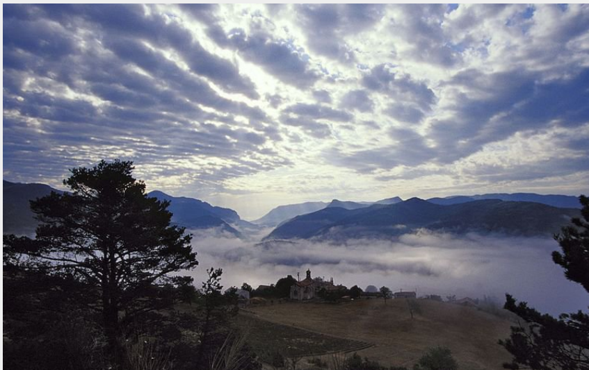
Etoile-Saint-Cyrice sous un ciel impressionnant (Bochaton)