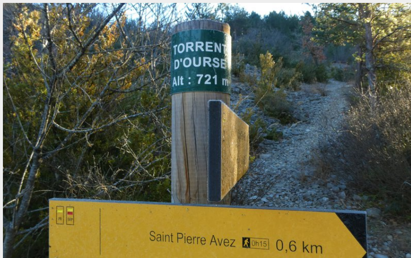
Suivre les indications signalétiques en chemin (CCSB)