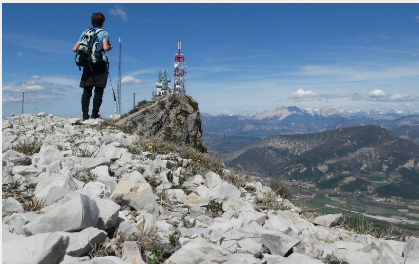
Sommet du Rocher de Beaumont (CCSB)