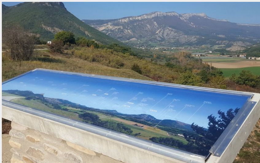
Table d'orientation (Office de Tourisme Sisteron Buëch)