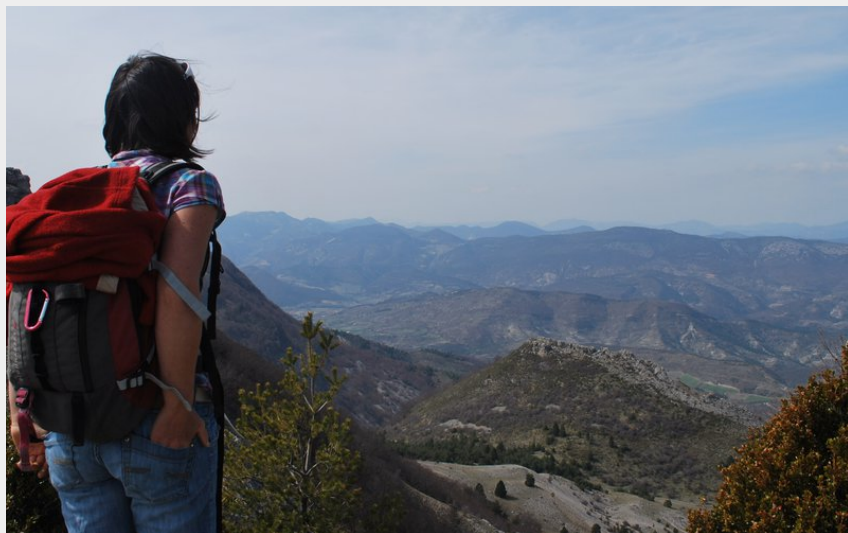
Petite halte pour admirer le paysage (CCSB)