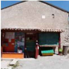
Tableau d'affichage (C)