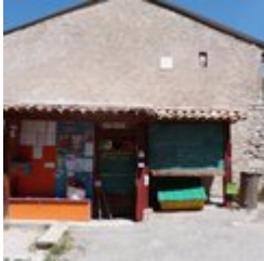
Tableau d'affichage (C)