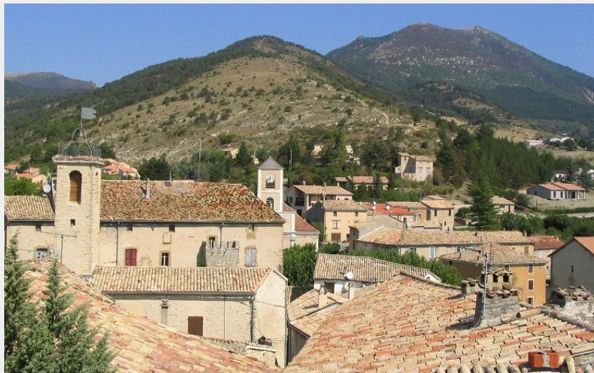
Rosans depuis les hauteurs (CCSB)