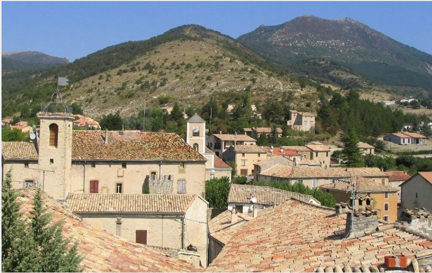
Rosans depuis les hauteurs (CCSB)