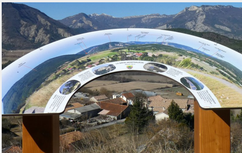
Table d'orientation (CCSB)