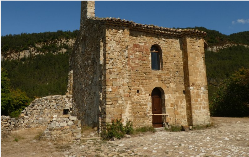
Chapelle St Cyrice (CCSB)