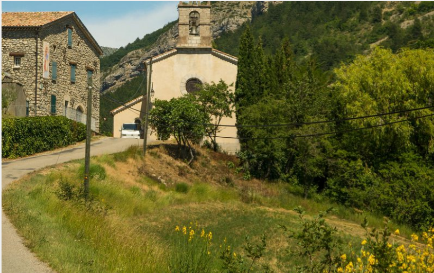
Eglise de Saint Genis (CCSB)