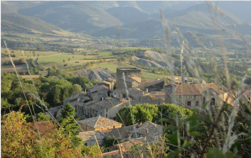
Les hauteurs de Rosans (CCSB)