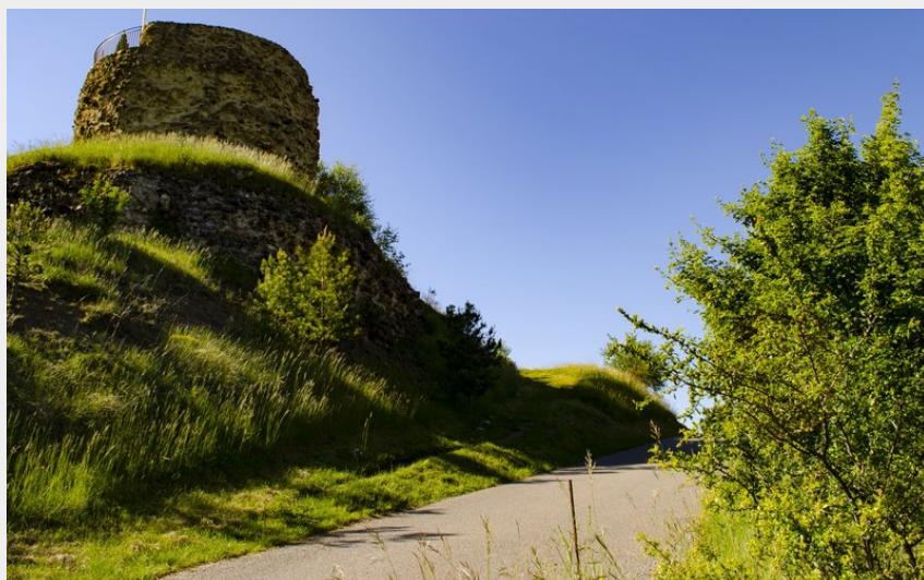
Montée à la tour (CCSB)