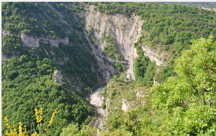
Panorama sur les Gorges de la Méouge (CCSB)