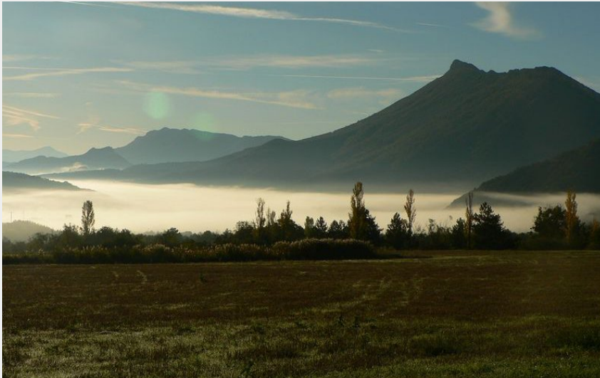
Belle lueur sur Arambre (CCSB)