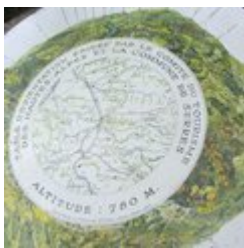
Table d'orientation (C)

Au détour d'un lacet du sentier et juste à côté de la Chapelle Notre-Dame-de-Bon-Secours, profitez d'une superbe vue sur la vallée du Buëch. Un table d'orientation érigée par le Comité du Tourisme des Hautes-Alpes et la Commune de Serres permet de profiter du panorama.