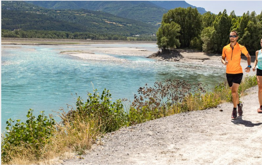
Sur le chemin entre la Durance et le plan d'eau