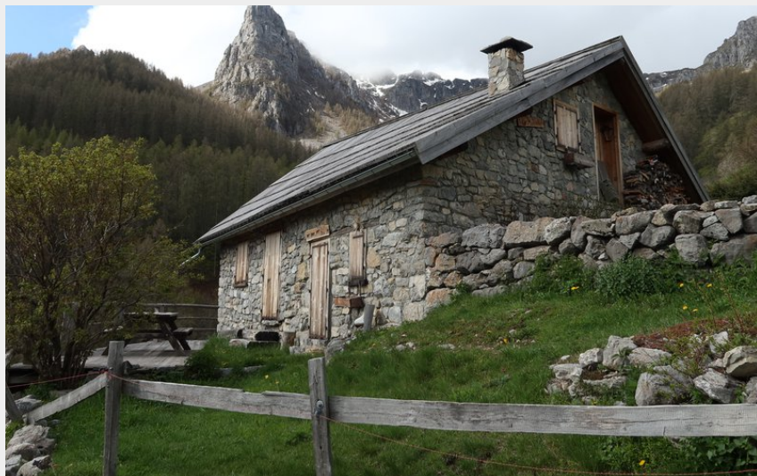
Chalet de Vaucluse (Lucien Mariotte)