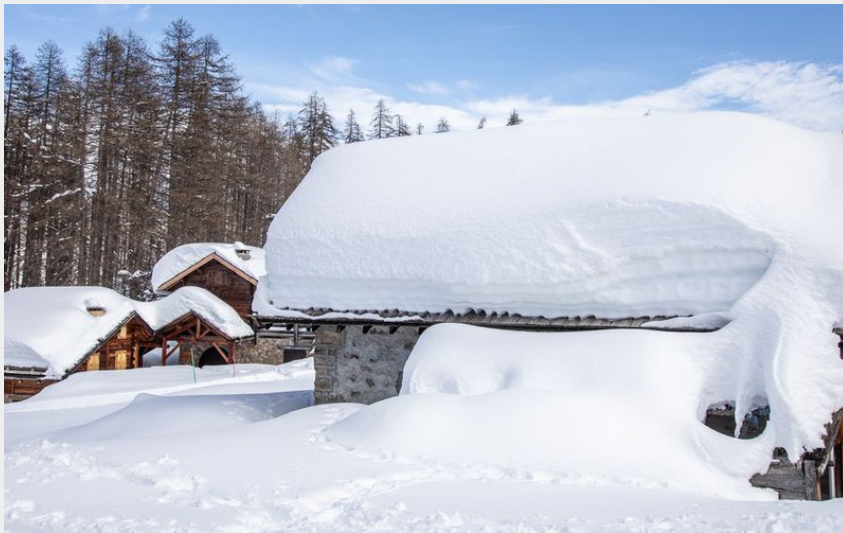
Les Têtes (Thibaut Blais)