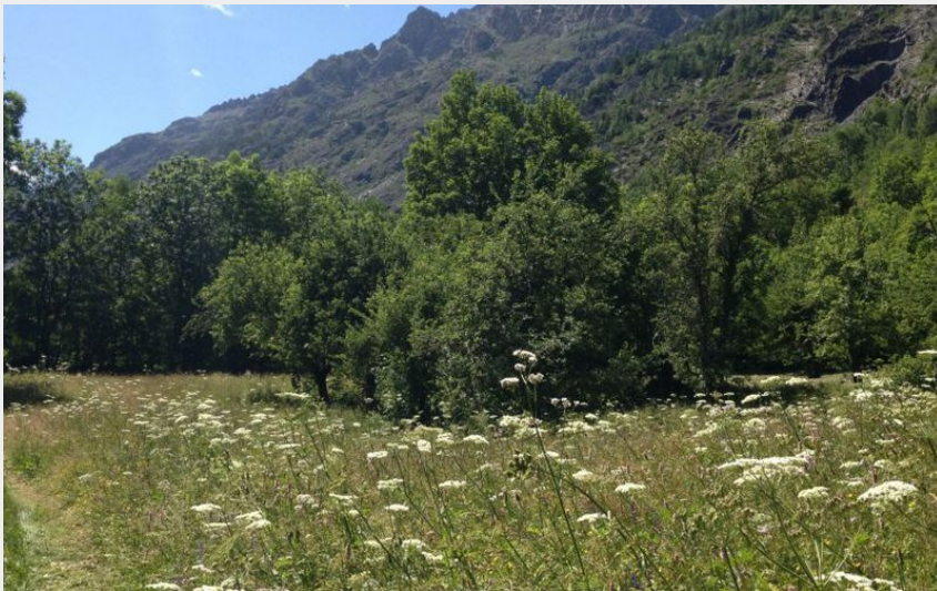
Chemin au bord de l'Onde