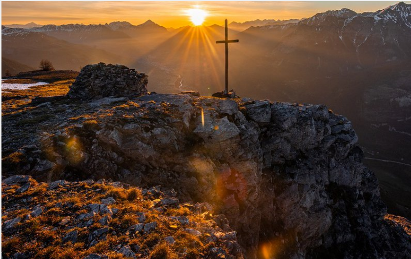
Lever de soleil croix de la Salcette (Thibaut Blais)