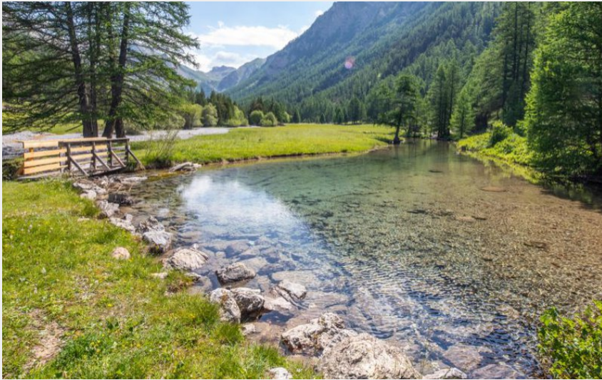
Hameau du Lauzet (Thibaut Blais)