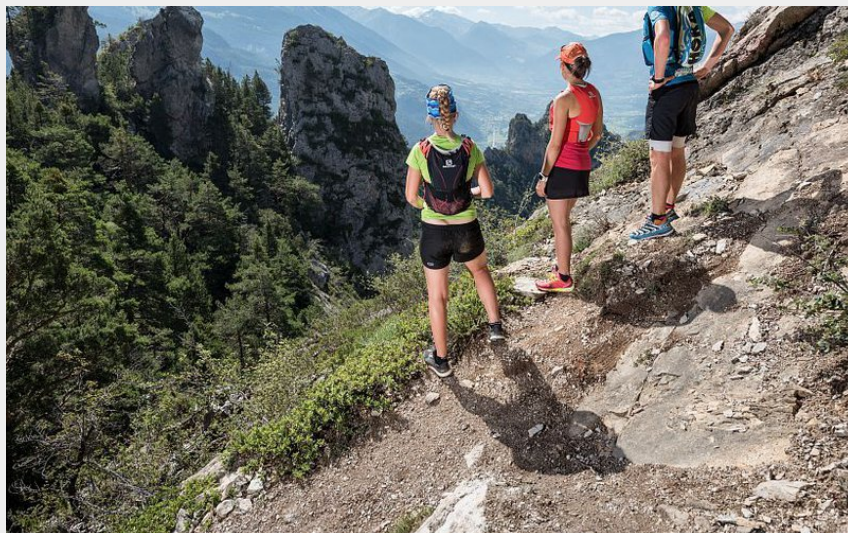
Trail Rortie Bleue (Ayesta - Parc national des Écrins)