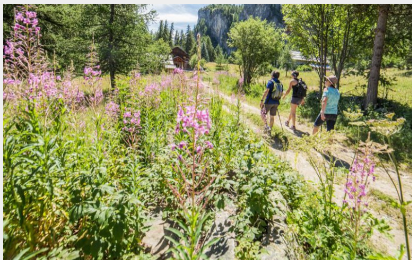
Col de la Pousterle