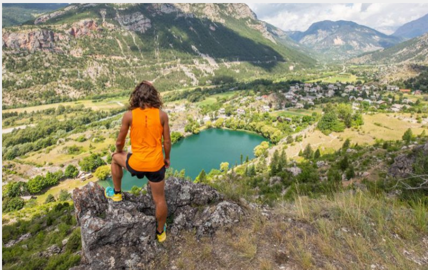
Vue sur le lac de La Roche-de-Rame (Thibaut Blais)