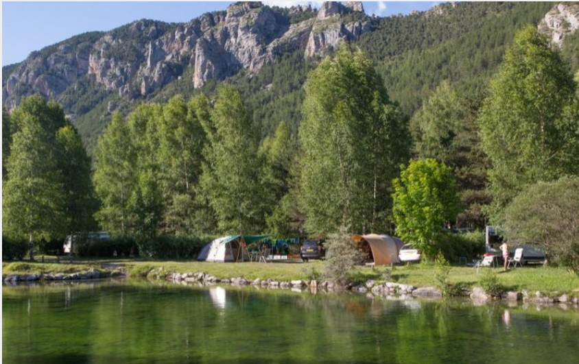
Les Allouvières (Thibaut Blais)