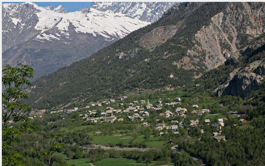
Village des Vigneaux et plaine de la Vallouise (Parc national des Écrins - Bernard Nicollet)