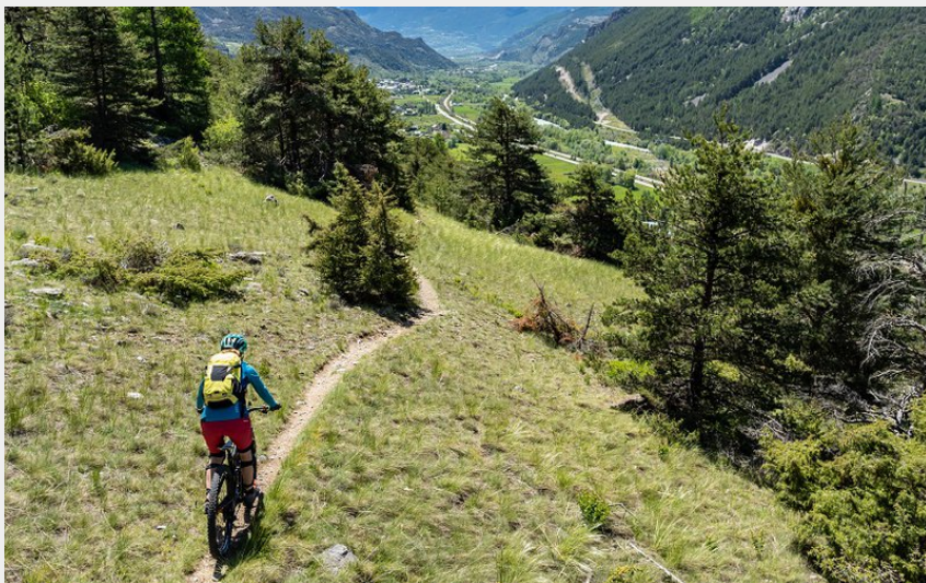
sentier les eyssuches (rogiervanrijn)