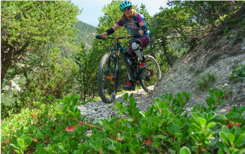
sentier en forêt d'adret (rogiervanrijn)