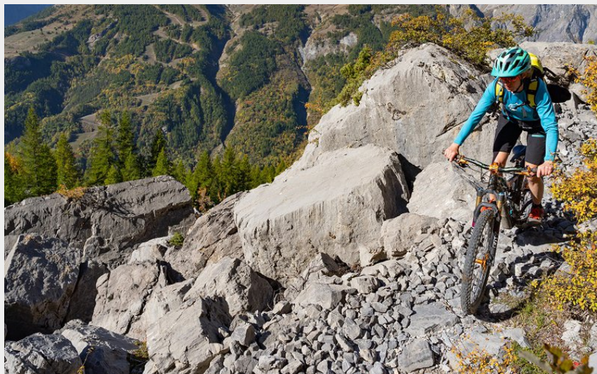
vue sur le Pelvoux (rogjervanrijn)