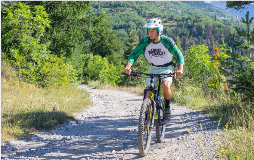
Chapelle Saint Ours (Thibaut Blais)