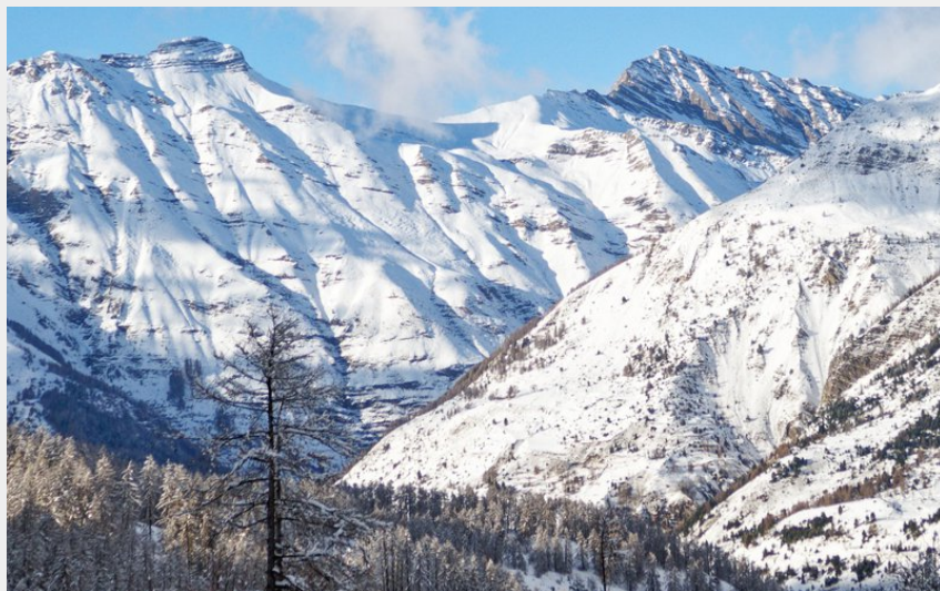
Sommet de l'Aiguille d'Orcières (Lucien Mariotte)