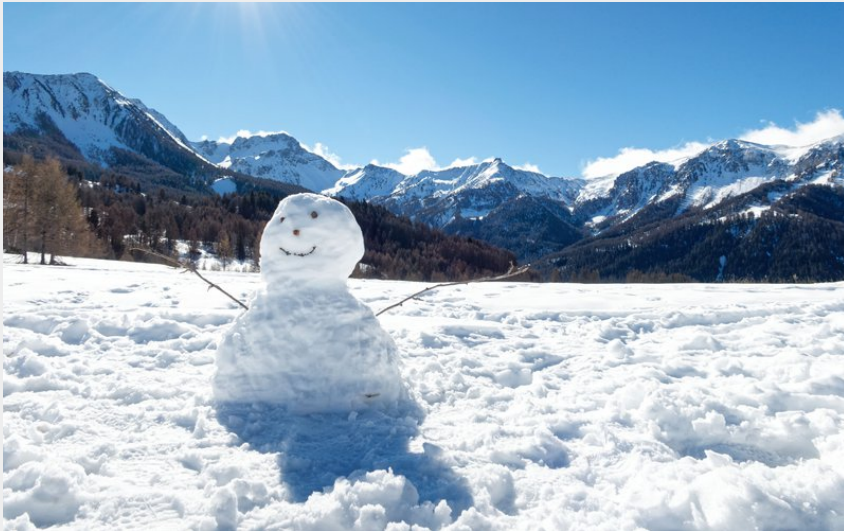
Plateau de la Draye (Lucien Mariotte)