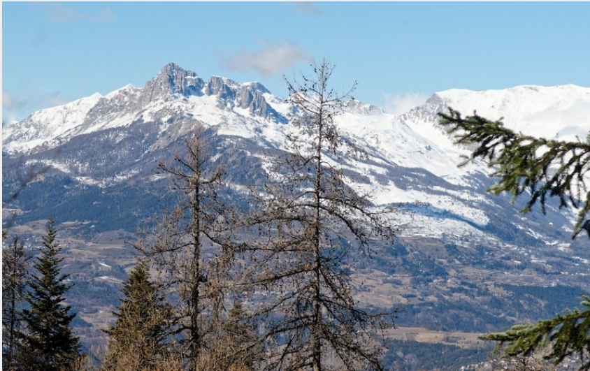
Aiguilles de Chabrières (Lucien Mariotte)