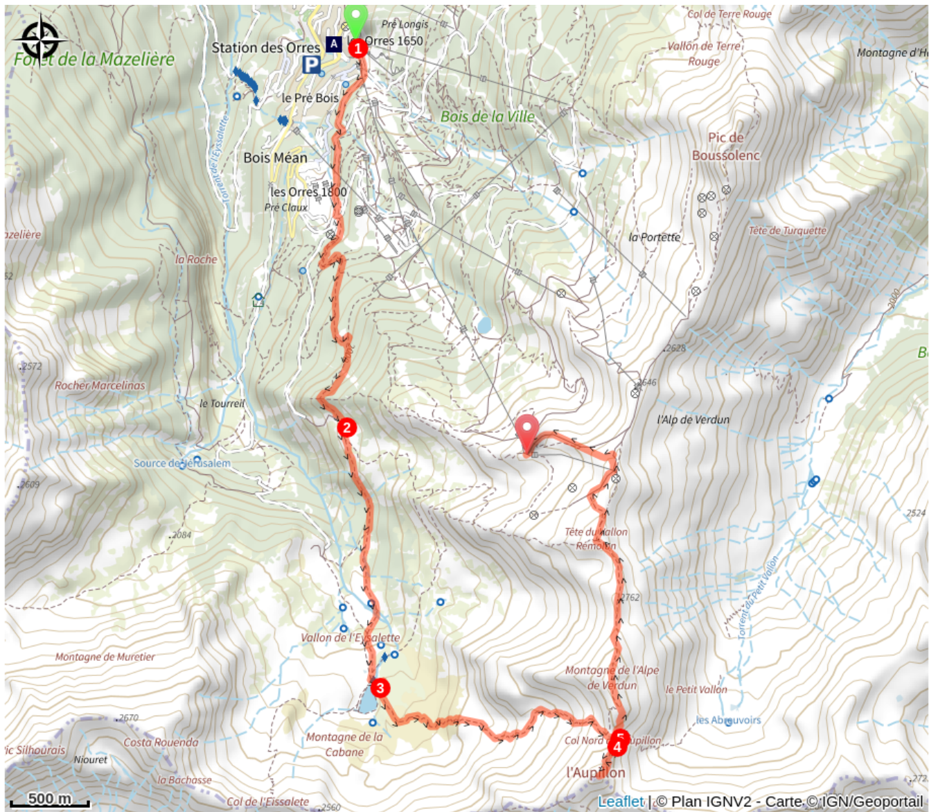
Station des Orres (A)