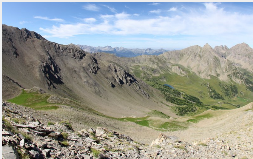
Lac Sainte Marguerite depuis les crêtes (Alice Simonard)