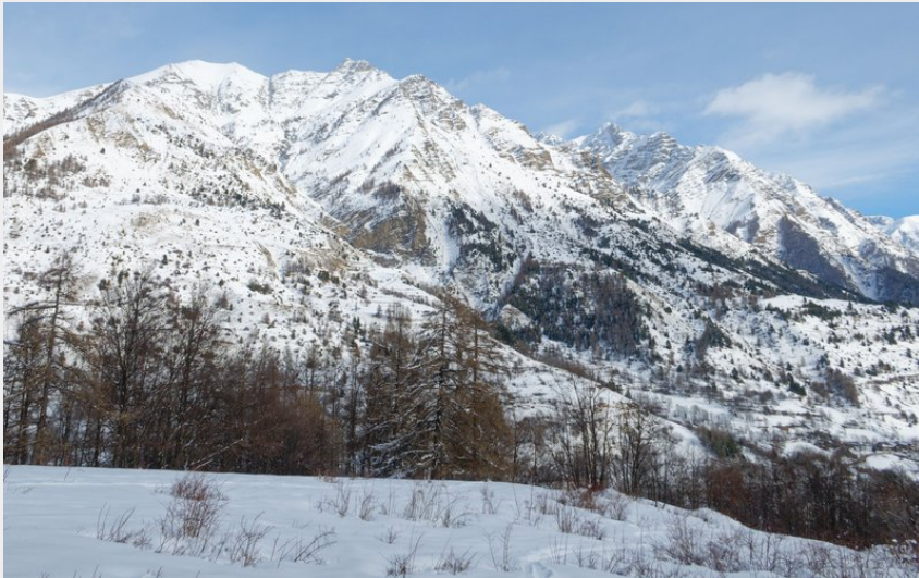
Tête de l'Eslucis (Lucien Mariotte)