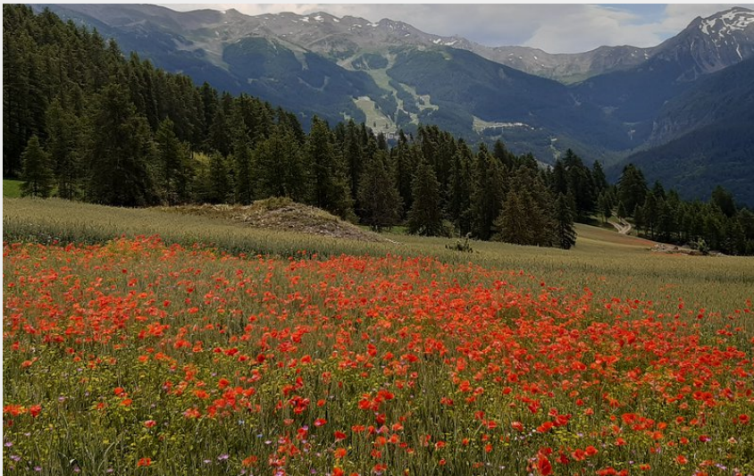
Champ de coquelicots (florimont.tilliere)