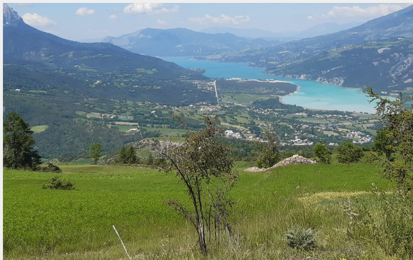
Le lac de Serre-Ponçon